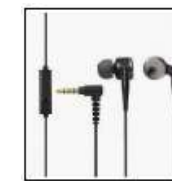
マイク付イヤホン