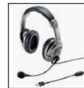
ヘッドセット※推奨